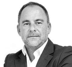
DIRECTOR: D. Miguel Ángel Sánchez Valenzuela

Contamos con un claustro de profesores constituido por excelentes docentes y contrastadas trayectorias profesionales en puestos de responsabilidad y dirección en empresas nacionales y multinacionales de renombre. Estos profesores, acompañarán dentro y fuera del aula a los alumnos, ofreciendo atención individualizada, gracias a las diferentes herramientas de comunicación que hoy en día nos brinda internet. Como complemento, también contaremos con profesores invitados